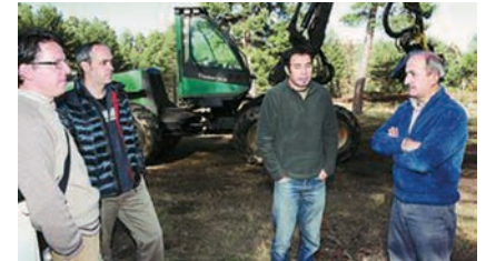
table. ¿Si hay territorios que viven del aprovechamiento forestal, por qué no nosotros?"

"La frase ' la madera ya no vale nada ' es antigua y negativa, lo que hay que hacer es dar más valor a la madera en una primera transformación hasta que sea ren-