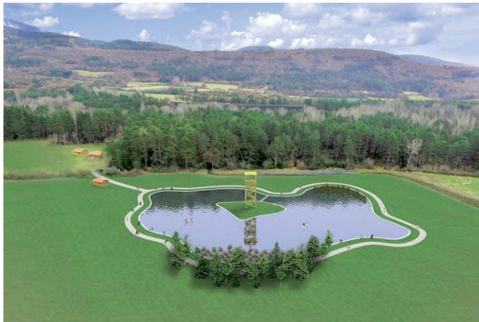
Simulación del lago artificial.

El lago, de 8.000 m 2 , será el elemento que recibirá a los visitantes del parque de aventuras El Juncaral. La idea del ayuntamiento es iniciar las obras en los próximos meses y avanzar en su construcción con el objetivo de que esté operativo en el verano de 2017. "Es una idea diferenciadora e innovadora, que completará los usos recreativos y deportivos que ya existen en El Juncaral, y que respetará totalmente el entorno en el que se ubicará", señalan desde alcaldía.